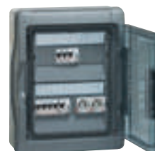
4 019 95