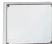
0 391 42