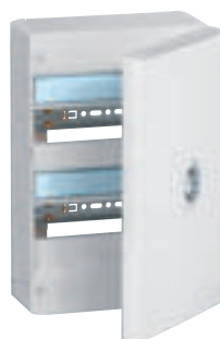
4 012 12 + 4 013 32