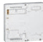
4 011 82