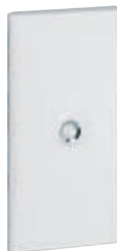
4 013 33