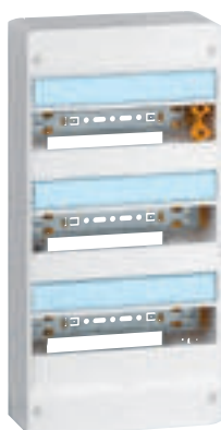
4 012 13