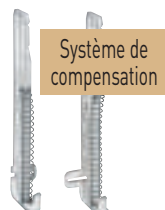
0 300 68 - 2 pieds sur ressorts livrés avec cache de finition