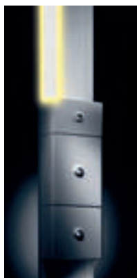
Couvercle à LED réf. 0 300 05 installé sur GTL