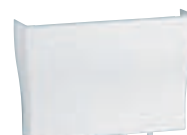
0 300 71