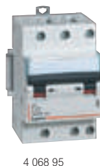
4 068 95