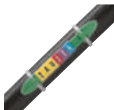
Repérage ouvert avec porte-repères réf. 0 384 55