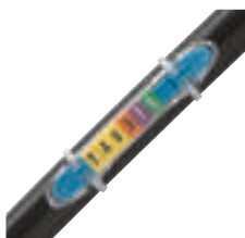
0 384 56 avec repères et capot de protection réf. 0 384 97