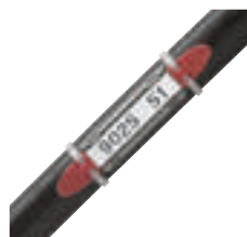
0 384 52 avec étiquette et porte-étiquette réf. 0 384 98