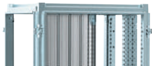
4 046 00