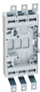
4 222 22