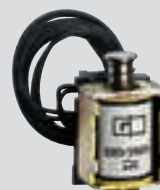
Déclencheurs à émission de courant