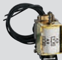
Déclencheurs à minimum de tension retardés