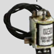
Déclencheurs à minimum de tension