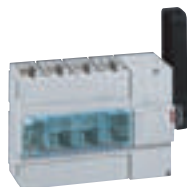
0 266 47