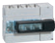
0 266 37