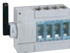
0 266 70