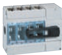
0 266 62

interrupteurs-sectionneurs 400 A à 630 A