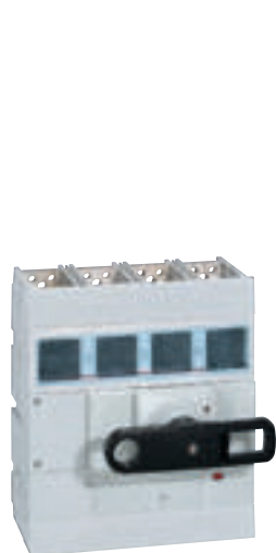
0 265 98

interrupteurs-sectionneurs 800 A à 1600 A