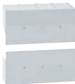
0 262 65

Caractéristiques techniques p. 373 Cotes d'encombrement catalogue en ligne