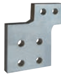
0 281 59