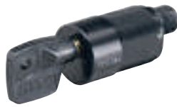
0 281 81