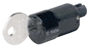
0 281 78