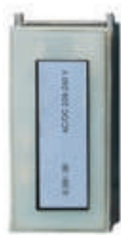
0 281 39