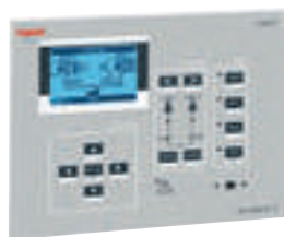
Boîtier d'automatisme réf. 4 226 83 (p. 368)