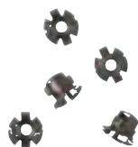
0 200 92