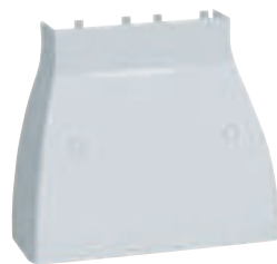
0 201 60