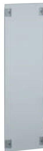
0 201 45