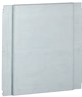
0 206 45