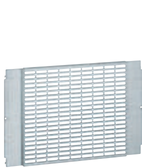
0 206 42