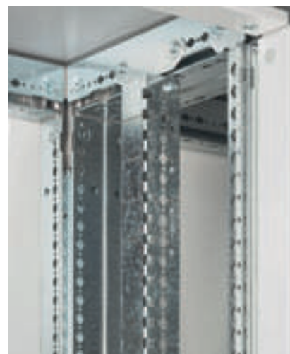
0 205 12

Cotes d'encombrement p. 316 Tableau de composition p. 317