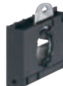
0 229 68

Caractéristiques techniques p. 284 et catalogue en ligne Mode de montage des étriers catalogue en ligne