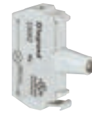
0 230 82