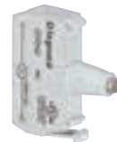
0 229 42