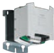
0 470 24