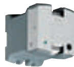
0 470 53