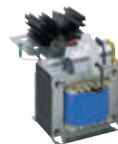
0 470 66

Caractéristiques techniques p. 252 et catalogue en ligne Schémas de principe catalogue en ligne Protections p. 254-255