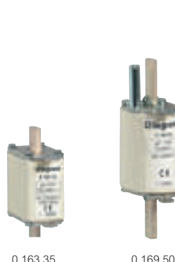
0 163 35