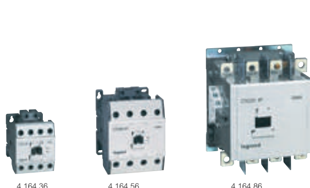
4 164 36