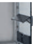
Accessoires (p. 207)