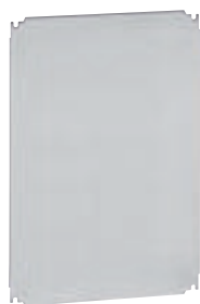
0 360 58