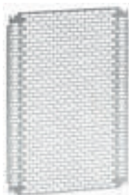
0 360 18