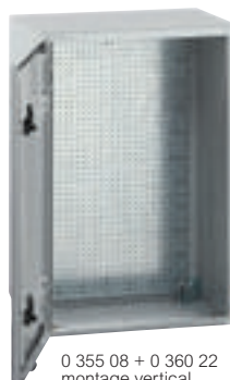
0 355 08 + 0 360 22 montage vertical