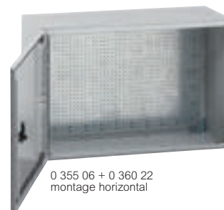
0 355 06 + 0 360 22 montage horizontal

Caractéristiques techniques p. 177 Visserie et fixation d'appareillage p. 209