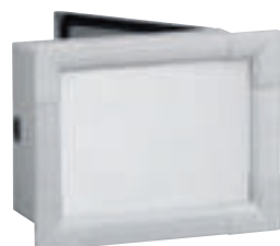
0 357 77 avec face avant fixe et porte arrière

Caractéristiques techniques p. 167 et catalogue en ligne