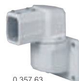
0 357 63