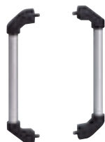
0 357 59