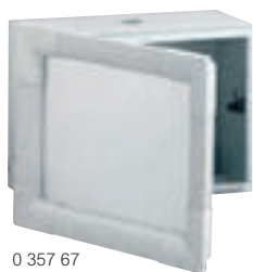
0 357 67