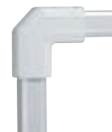
0 357 37

Caractéristiques techniques catalogue en ligne Agréments p. 1132