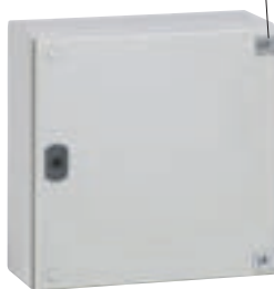
0 356 08 avec verrou 0 358 08 et charnières 0 358 07

Patte de fixation inox à positionner horizontalement ou verticalement (vue arrière du boîtier)