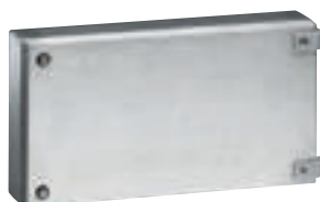
0 356 56 avec charnières 0 358 07