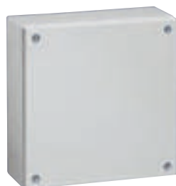
0 356 08