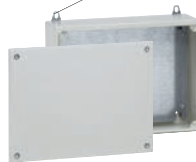
0 356 11 avec plaque 0 356 67 et pattes de fixation 0 364 07