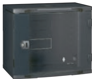
0 462 01