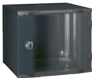
0 462 11