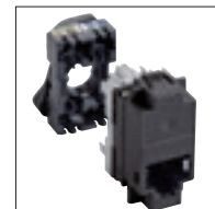
Connecteur cat. 5e FTP