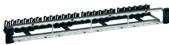
0 335 90