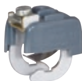
0 343 85