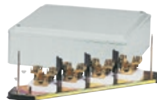
0 330 74