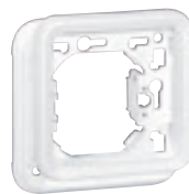
0 707 92