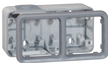
0 696 72