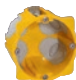
0 800 21