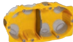
0 800 22