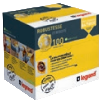
0 800 12

boîtes d'encastrement pour cloisons sèches