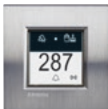
LN4651 + plaque Acier Brossé LNA4802ACS