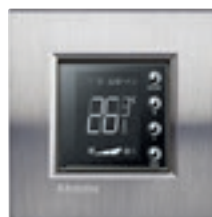
LN4691 + plaque Acier Brossé LNA4802ACS