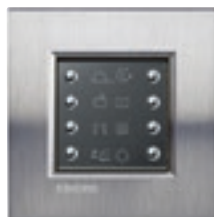
LN4652 + plaque Acier Brossé LNA4802ACS