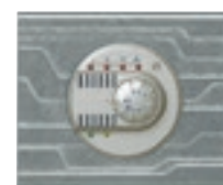
0 674 55 + enjoliveur + plaque Furtif 0 690 41