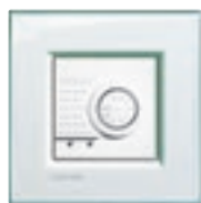
N4692 + plaque Aigue Marine LNA4802KA