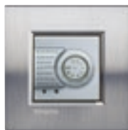
NT4692 + plaque Acier Brossé LNA4802ACS