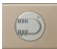
0 674 58 + enjoliveur + plaque Nickel Velours 0 691 11