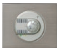
0 674 57 + enjoliveur + plaque Inox Brossé 0 691 01