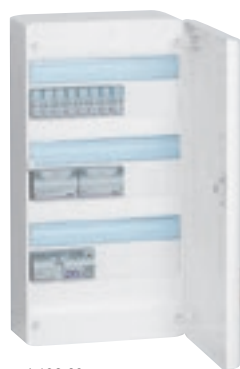
4 132 63