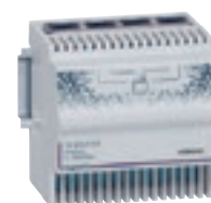
4 131 18

Principes d'installation et caractéristiques techniques p. 568-569