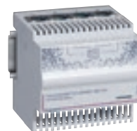
4 130 09