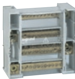
0 048 77