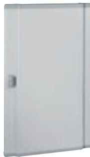
0 202 55