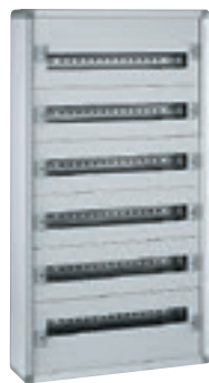
0 200 06

coffrets de distribution métal "prêts à l'emploi"