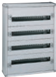
0 200 04

Tenue au feu selon IEC 60695-2-11 : 750 °C pour installation dans les ERP Châssis extractible avec rails montés Barreau laiton pour conducteurs de protection monté : 36 trous 1,5 à 10 mm 2 et 2 trous 35 mm 2 Capacité 24 modules par rangée RAL 7035 Livrés complets avec rails et plastrons Portes à commander séparément Permettent la réalisation d'ensembles certifiés selon NF EN 61439-2 et -3 IP 43 - IK 08 avec joint et porte IP 40 - IK 08 avec porte IP 30 - IK 07 sans porte Flancs latéraux amovibles Haut et bas amovibles et sécables pour insérer la plaque passe-câbles découpable (à commander séparément)