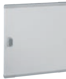
0 202 73