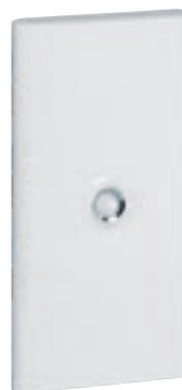
4 013 33