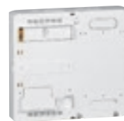
4 011 82