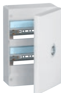
4 012 12 + 4 013 32