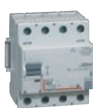
4 118 48

Caractéristiques techniques p. 534 Performance des différentiels p. 538