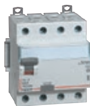
4 116 76