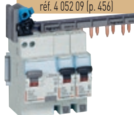
4 116 51