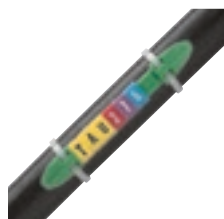
Repérage ouvert avec porte-repères réf. 0 384 55