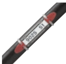
0 384 52 avec étiquette et porte-étiquette réf. 0 384 98