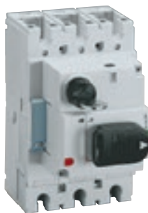
4 210 00