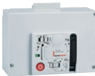
0 261 27