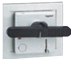
0 262 61