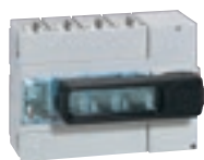
0 266 37