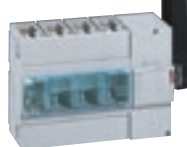
0 266 47