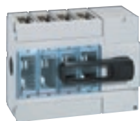
0 266 62