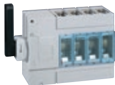
0 266 70