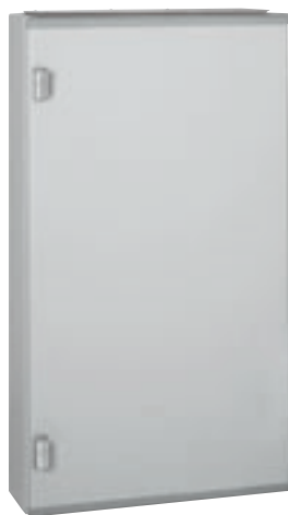
0 201 85