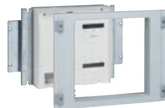
0 202 31