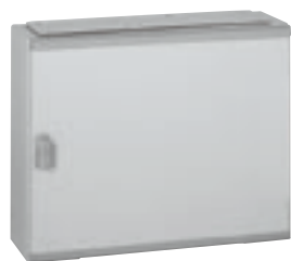
0 201 82