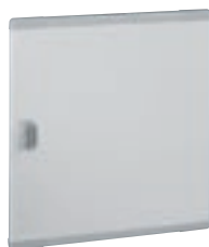
0 202 73