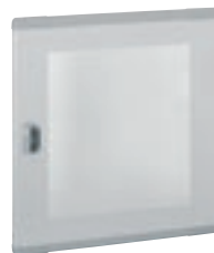
0 202 83