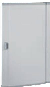
0 202 55