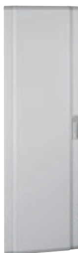
0 202 59