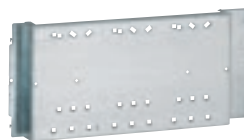
0 206 20

équipements pour montage DPX 3 630 et 1600 sur platine