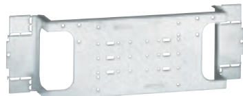
0 206 17