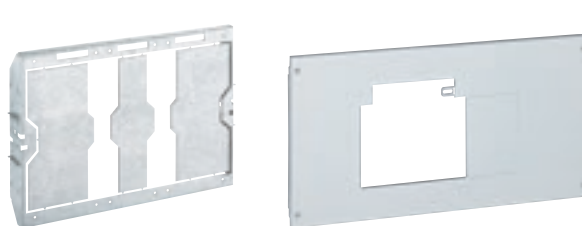
0 210 60

extractible ou débrochable sur platines réglables