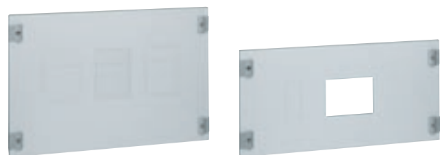
0 208 20

montage des DPX 3 630 version fixe sur platines réglables