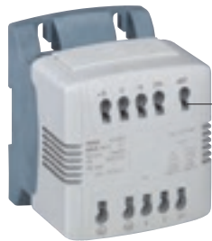
0 442 02