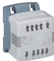
0 442 51

Caractéristiques techniques p. 267-268 et catalogue en ligne Protections p. 278-279 Agréments p. 1136