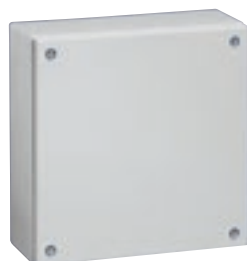
0 356 08