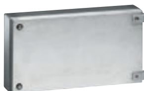
0 356 56 avec charnières 0 358 07