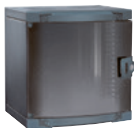
0 462 20