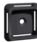
0 320 68