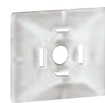
0 320 65